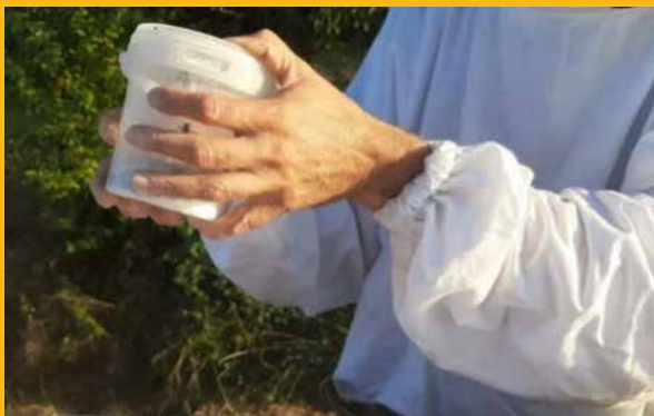
Posudu lagano tresemo 60 sekundi