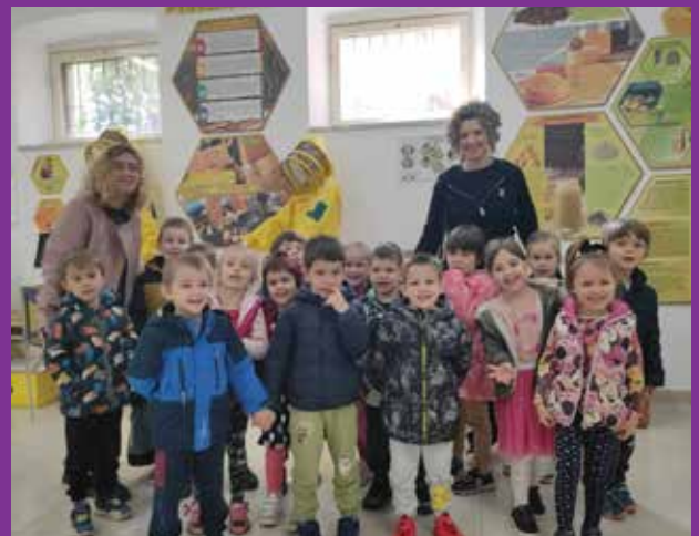
Vrtićka djeca u posjeti Danima pčela