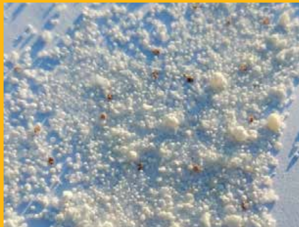
Utvrđivanje broja varoa na bijelom papiru