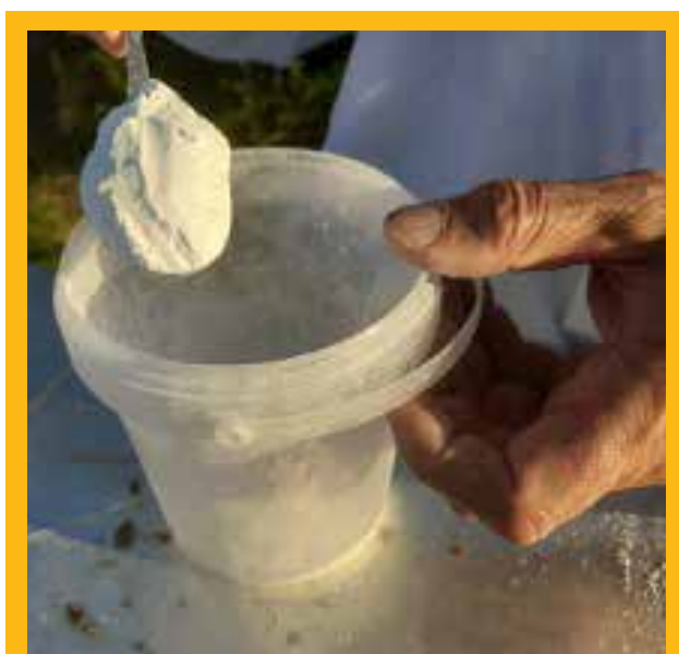
Potrebne su dvije jušne žlice šećera u prahu

K ontrola prirodnoga dnevnog pada varoa ima svoje nedostatke ako pčelar mora svaki dan putovati do pčelinjaka te spoznaje da mravi vole pojesti varoe. Otklapanje trutovskog legla složenija je metoda jer traži pregled 200 stanica s trutovskim leglom, dok je ispiranje pčela agresivna metoda u kojoj na kraju ubijamo pčele, stoga se ne preporučuje osim ako ne provodimo znanstvena istraživanja. Dakle u pravilu se preporučuje posipanje šećera u prahu po pčelama s dvostrukim prosijavanjem. Pritom se za mjeru upotrebljava manja plastična posuda od 120 mililitara koja se napuni pčelama (trebalo bi biti između 40 i 50 grama pčela). Preporučuje se da se pčele stresu s mednog okvira koji se nalazi odmah do legla u plodištu ili iznad legla (vrlo je pogodan drugi okvir po redu od stijenke iznad matične rešetke, neovisno lijevo ili desno). U drugu posudu, zapremine oko 800-900 mililitara, stave se dvije jušne žlice (oko 35 grama) šećera u prahu. Ta posuda na vrhu ima sito kroz koje pčele ne mogu proći, a služi da im se omogući disanje tijekom postupka. Zatim se pčele hitro prebace iz manje posude u veću sa šećerom, zatvorimo ju rešetkastim poklopcem (koji ima sito) te fiksni poklopcem, a potom posudu