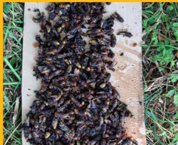
Impresivna količina ulovljenih stršljenova