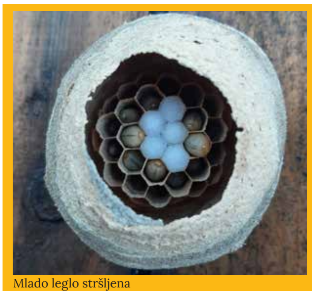
Mlado leglo stršljena

N a jednom smo svojem pčelinjaku 2022. godine pri oduzimanju okvira s medom imali susret