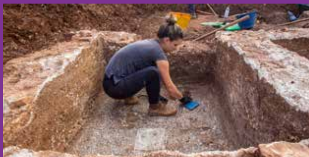
Čišćenje antičkog bazena s mozaičnim podom i taložnicom, za maslinovo ulje

– Brojni nam nalazi sad otkrivaju da se taj drevni grad prostirao na mnogo većem području nego što se to znalo. Faroska hora, koja je od samih početka predstavljala vitalni faktor za opstanak novoosnovanoga grčkog grada, njegovala je raznolike gospodarske grane, uključujući i proizvodnju meda. Na to upućuje niz keramičkih ulomaka pronađenih tijekom arheoloških istraživanja, a koje predstavljaju krhotine cilindričnih antičkih košnica. Rezultati s kraja prošle godine pružili su uvid i u nešto mlađe materijalne ostatke prethodno nepoznatoga antičkoga (rinskoga) gospodarsko-prerađivačkog kompleksa, koji je podignut nad tada već višestoljetnim ostacima grčkog bedema, s nalazom uljare, odnosno bazenima s mozaičnim podom i kamenom taložnicom, za koje se pretpostavlja da su skladištili maslinovo ulje, i kamenim stupovima koji su bili dijelovi tijeska za prerađivanje maslina. Ulomci obojenih fresaka mogli bi upućivati i na postojanje stambenoga dijela sklopa, dok sitni pokretni nalazi poput udica, utega te ulomaka amfora i košnica dodatno govore o aktivnostima njegovih tadašnjih žitelja – zaključuje dr. Ugarković, što potvrđuje našu raniju tezu o dugotrajnosti i važnosti pčelarstva na otoku Hvaru, dok o kvaliteti meda i ostalih pčelinjih proizvoda u dovoljnoj mjeri govore brojna priznanja hvarskih pčelara s raznih manifestacija i natjecanja, kako u domovini tako i u inozemstvu.