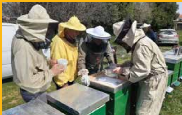
Prosijavanje šećera kroz sito