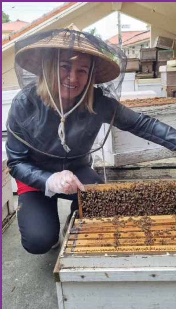
Pčelarenje s europskom medonosnom pčelom na Okinawi

Napomena: Članak je dio pčelarskih priča i putopisa Zajedno čuvajmo pčele, koji pišem prema vlastitom iskustvu i načelu ...putujem, poučavam i učim o pčelama... Galeriju s više fotografija možete pogledati na mojem profilu na Facebooku.