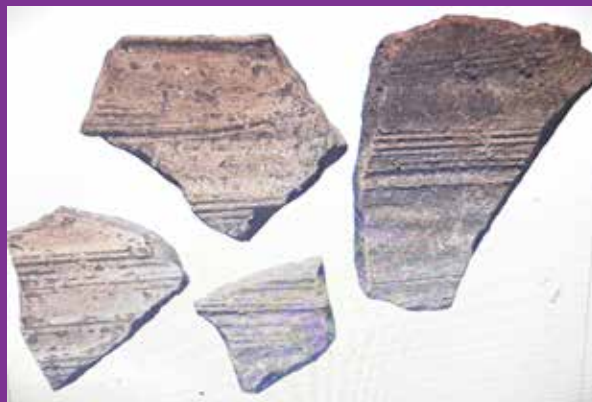
Ulomci antičkih košnica pronađeni u Starome Gradu