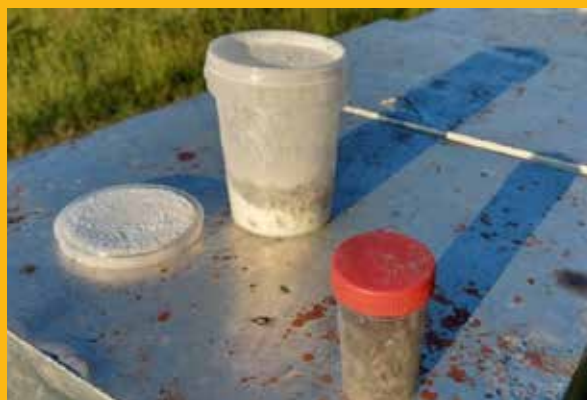
Uklonimo fiksni poklopac i pričekamo, a za to vrijeme možemo pripremiti uzorak pčela iz druge zajednice