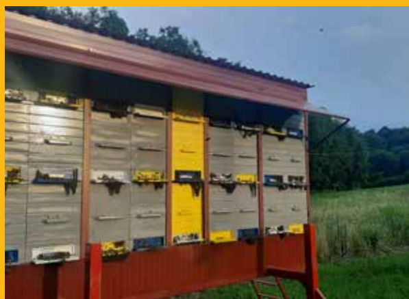
Proizvodnje matica nema bez uzgoja trutovskih zajednica

N a pčelinjaku za uzgoj matica, ali i na bilo kojem pčelinjaku za koji se vlasnik imalo brine, nalaze se pčelinje zajednice koje su odabrane selekcijom i koje zadovoljavaju sve zahtjeve koje smo postavili i pritom pokazuju najbolje rezultate. U takvim se pčelinjim zajednicama uzgajaju trutovi, i to planski i organizirano. Zna se da trut živi oko 45 dana te da je nakon 12. dana spolno zreo. Također se zna da se trut leže 24. dana od polaganja neoplodenog jajašca. Sve ovisi o početku uzgoja matica, tad se naime usklađuje uzgoj trutova u takozvanim očinskim zajednicama. To znači da moramo rano pristupiti stimulatívnoj prihrani ovih zajednica jer nam je cilj da u trenutku kad imamo prve neoplođene matice imamo i što veći broj trutova koji su uzgojeni u tim očinskim zajednicama. Što nam to govori? Da trutovi koji su uzgojeni u takvim zajednicama nisu slobodni strijelci koji izlijeću iz košnice i vraćaju se kada im se to sviđa. Njih iz košnica puštamo sami, i to kad velika većina trutova iz drugih košnica ne leti (a to je oko 16 ili 17 sati poslije podne). A zašto ovako kasno poslije podne? Zato što jako malo ptica leti u to vrijeme te je