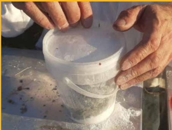
Zatvorimo posudu sa šećerom