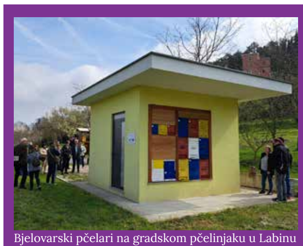
Bjelovarski pčelari na gradskom pčelinjaku u Labinu

TEKST: Damir Gregurić, portal „Pčelina školica“