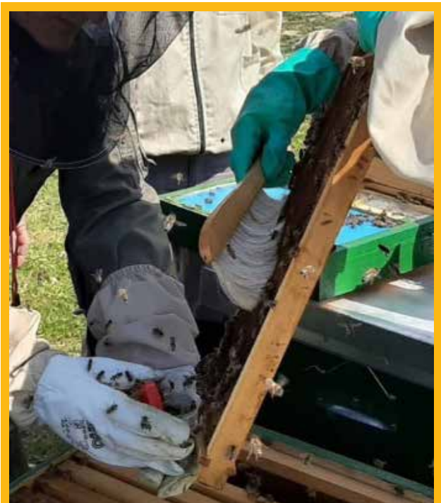
U plastičnu se posudu stavi 40–50 grama pčela skupljačica

U ovom ćemo se broju posvetiti povezanosti klimatskih promjena i naše stare prijateljice