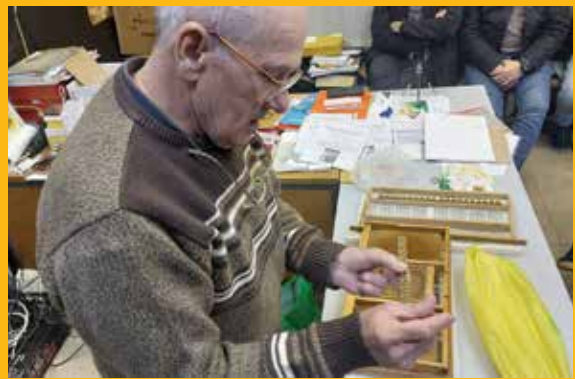
Presađivanje ličinki u osnove matičnjaka

– U društvo iz kojeg ćemo uzimati ličinke moramo staviti aparat na poliranje i nadogradnju saća oko njega ako ga upotrebljavamo prvi put. Time ga pripremimo za zalijeganje matice. To radimo tako da ga stavimo u medište i malo ga poprskamo sirupom ili razrijeđenim medom. Ako oko aparata treba nadograditi saće, onda ga treba smjestiti između okvira s leglom u plodište. Bitno je da saće bude izgrađeno barem do pola. Nakon