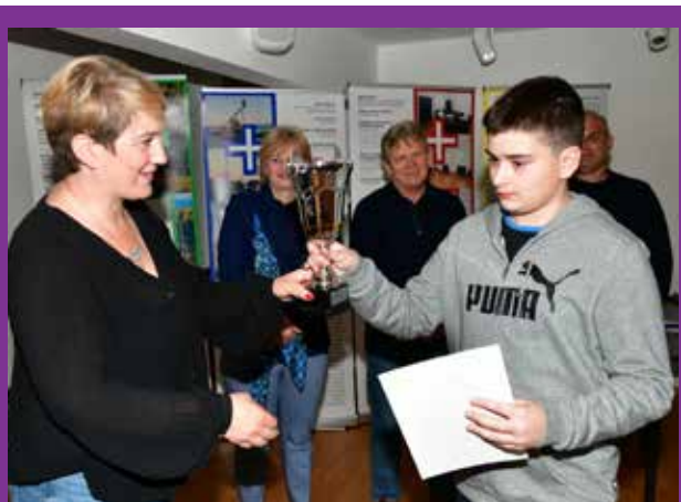
Najmlađi brački pčelar

Riječ je o provedbenom aktu koji Europska komisija može donijeti, ali uz kontrolu država članica. Kao što je poznato, Međunarodna agencija za istraživanje raka smatra da je glifosat vjerojatno kancerogen za ljude,