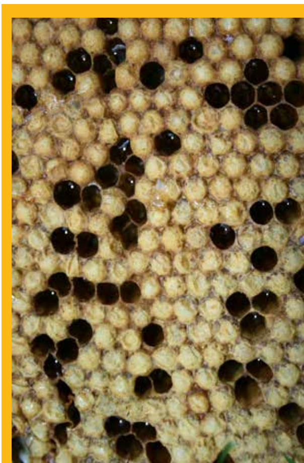
Trutovsko leglo sadrži potencijalni genetski materijal

košnice, a na njihovo mjesto staviti prazne okvire da ih pčele ponovno izgrade. Pritom ponavljamo i dodavanje 60-postotne šećerne otopine. Pčelinjim zajednicama kojima dodajemo po okvir poklopljenoga trutovskog legla zapravo pomažemo da ne moraju same uzgajati trutove zbog biološke potrebe za njima. Možete biti sigurni da ih ni na jednom okviru pčele neće izvlačiti, no za svaki je slučaj dobro izrezati trutovsko leglo u košnici u koju smo dodali poklopljeno trutovsko leglo. Nema nekog posebnog pravila kad dodati poklopljeno trutovsko leglo nekoj drugoj pčelinjoj zajednici, najvažnije je da se iz tih okvira trutovi izlegu i da ih na pčelinjaku bude što je moguće više. Mladi trutovi koji se izlegu iz okvira građevnjaka u bilo kojoj košnici iznimne su kvalitete, a i njihova je brojnost zadovoljavajuća te prilikom parenja s maticama prenose dobre osobine na nove generacije pčela. Primjenom ovakvog ili nekog drugog načina uzgoja trutova na pčelinjacima mogu se vidjeti prvi pozitivni rezultati. Pčelari koji prepuštaju sparivanje matice slučaju nikako ne mogu prinose uspoređivati s pčelarima koji na svojim pčelinjacima rade djelomičan ili potpun odabir. Prilikom razmjene matice ili cijelih zajednica između pčelara treba voditi strogu evidenciju o porijeklu i pasmini pčela. Naravno da visoko odabiranje treba prepustiti institucijama i stručnjacima, dok pčelar sa skromnim znanjem biologije i fiziologije pčela odabir (selekciju) provodi na opisan način.