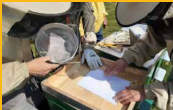
Utvrđivanje broja varoa na bijelom papiru