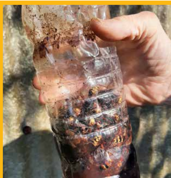
Plastična boca odlična je zamka za stršljenove

tijekom ljeta su naselili stršljenovi. Moja se malenkost nije ni sjetila preko noći zatvoriti leto i stršljenove te ih odnijeti daleko i dokrajčiti. Evo što uradim. U praskozorje, dok još sunca nije bilo, opremljen pčelarskim šešikom i bez rukavica kao kad radim s pčelama (što ne preporučujem!) čekao sam neko vrijeme dok stršljeni nisu počeli polako izlaziti na pašu. Nakon što ih je desetak izašlo, zatvorio sam leto. Nakon nekog vremena vraća se prvi stršljen te traži ulaz, kojeg više nema, a ja ga pritisnem okomito drvenom letvom. Nakon pet ubijenih stršljenova otvaram leto i puštam novu petoricu te ga ponovno zatvaram. Slijedi povratak pet stršljenova iz prve ture... i tako sam radio dok nisam završio sa svih 68. Ako stršljeni primijete vašu prisutnost, samo se morate ukipiti, to jest ostati nepokretni, a lov možete nastaviti nakon 10-20 sekundi. Uslijedilo je podizanje poklopne daske s nukleusa, pri čemu sam ugledao gnijezdo na tri etaže u kojem je bilo mladih stršljenova koji još nisu bili izlijetali i svih stadija ličinki. Pozdrav svim pčelarima ma gdje bili!