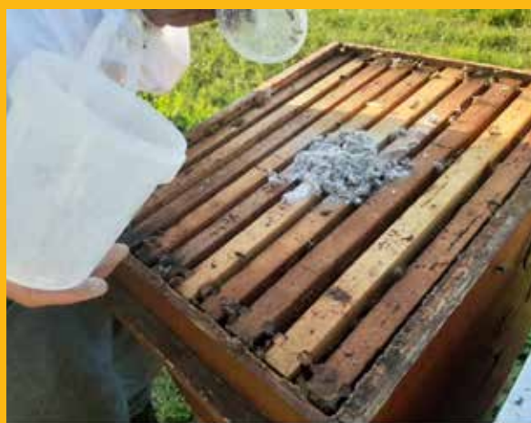
Pčele vraćamo u košnicu

Radi lakšeg brojenja varoa preporučuje se nakon prosijavanja istresti sadržaj na bijeli papir da se lakše točno utvrdi broj prisutnih varoa. Pčele vraćamo u košnicu. Nameće se pitanje na koliko bi pčelinjih zajednica pčelar trebao provesti dijagnostičko tretiranje varooze da bi dobio približan dojam o količini varoa u zajednicama, to jest o potrebi ranog, odnosno mogućega hitnog tretmana. Preporučuje se napraviti dijagnostičko tretiranje na deset posto pčelinjih zajednica koje u pčelinjaku nisu postavljene jedna blizu druge. Tablica 1. govori nam predstavlja li dobiveni broj varoa opasnost za pčelinju zajednicu i zahtijeva li ranu (ili hitnu) zaštitu protiv varooze nakon vrcanja meda. Ne smijemo zaboraviti da nametnička grinja V. destructor ima važnu ulogu pri pojavnosti i širenju drugih pčelinjih bolesti, posebice zbog imunodepresivnog učinka na staničnoj i „humoralnoj” razini imunostnog sustava invadirane pčelinje zajednice te mogućnosti mehaničkog prijenosa uzročnika pčelinjih bolesti, posebice virusa kojima služi kao mehanički i/ili biološki vektor i rezervoar infekcije. O povezanosti klimatskih promjena i novih problema (etine, tropileloze i azijskog stršljena) u Europi u sljedećem broju „Hrvatske pčele”.