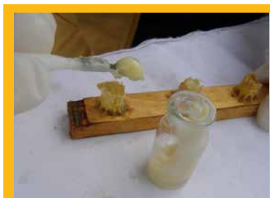
Počnite skupljati matičnu mliječ za vlastite potrebe

– Pčelariti sam počeo kao dječak s negdje 13-14 godina. Imao sam dva susjeda koji su držali pčele u pletarama i često sam im pomagao skidati rojeve. Kad bi roj otišao na visoko drvo, susjed nije imao dovoljno velike ljestve, stoga sam se ja penjao na drvo i hvatao ga. Jednom je