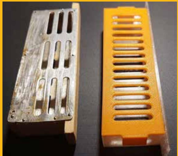
Kavezi za izolaciju matice

poliranja aparata maticu stavljamo u kavez aparata da zaliježe jajašca. Odmah nakon zalijeganja, koje se može dogoditi vrlo brzo nakon zatvaranja matice u aparat, maticu vadimo i dižemo okvir s aparatom u medište, gdje ga ostavljamo oko 92 sata (3 dana i 20 sati). Četvrti dan nakon zalijeganja presađujem ličinke u uzgajivačko društvo.