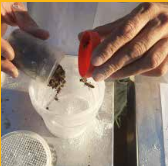
Pčele prebacimo u posudu sa šećerom

nježno tresemo oko 60 sekundi. Nakon toga odložimo posudu sa šećerom i pčelama (pritom otvorimo fiksni poklopac, a ostavimo rešetkasti poklopac sa sitom da se pčele ne uguše), pričekamo tri minute te potom snažno protresemo i ispraznimo sadržaj posude kroz sito na njezinu vrhu na drugo sito (u pravilu se rabi suho i čisto cjedilo za med). Nastavimo prosijavati sljedećih nekoliko minuta. Veličina rupica na drugom situ ne smije biti veća od varoe.