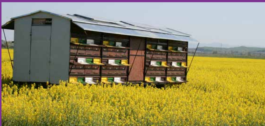
Trenutno je prag rentabilnosti proizvodnje meda iznad 12 kg po košnici