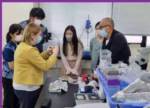
Laboratorijske rasprave o učincima EM-a na mikrobiom crijeva pčele